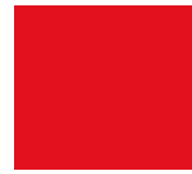
Basic Colors 185 C / U