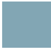
Basic Colors 2206 C / U