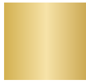
Metallic Basic Colors 871 C / U