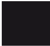
Colorit Trans 812

Si le titre est blanc, un film à chaud transparent brillant pour renforcer le relief et le chatoiement peut être appliqué (référence Kürz Colorit 949).